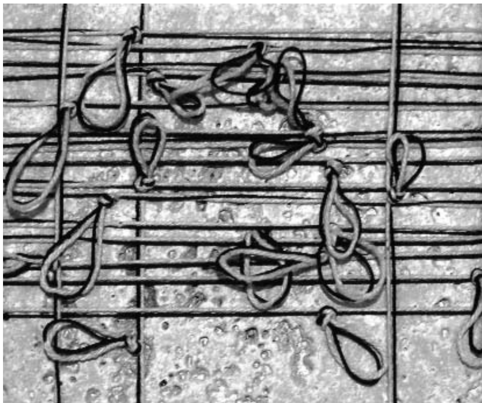
Carla Mura, Filo pietra , 2004, filo cotone su traverino, cm 10x10

Gli immigrati non sentono più come un tempo l’imperativo ad assimilarsi. Il senso di gratitudine verso il paese che li accoglie è stato sostituito da qualcosa di molto simile a un’idea antichissima, che si ritrova in molte religioni: quella che la terra sia stata data in comune a tutto il genere umano.